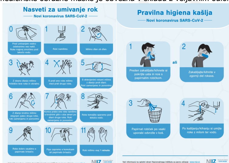
Slika 1: Navodila za higieno kašlja in umivanje rok.