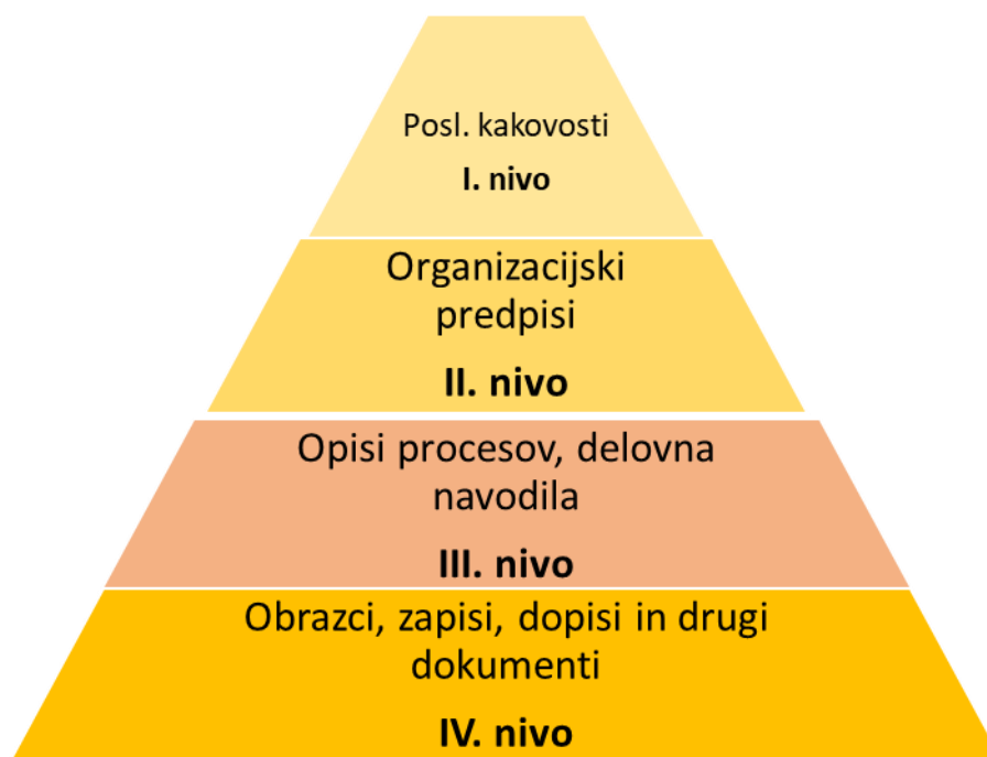
Slika 7.1: Nivoji dokumentiranih informacij

Posamezen nivo dokumentiranih informacij zajema naslednje: