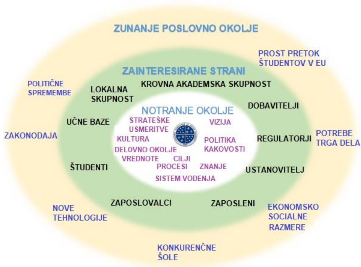
Slika 4.1: Razumevanje Alma Mater in njenega konteksta

Kot pomoč za prepoznavanje zunanjih in notranjih vprašanj, ki so pomembna za namen delovanja Alma Mater in njeno strateško usmeritev uporabljamo SWOT analizo. Pri tem analiziramo priložnosti in nevarnosti, ki izhajajo iz zunanjih politično-pravnih, ekonomskih, sociokulturni in tehnoloških dejavnikov (PEST), ter prednosti in slabosti, ki izhajajo iz notranjega okolja Alma Mater na katero imamo vpliv.